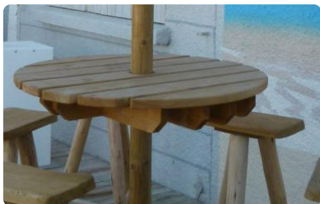
Idéale pour faire une table haute avec nos tabourets adaptés.